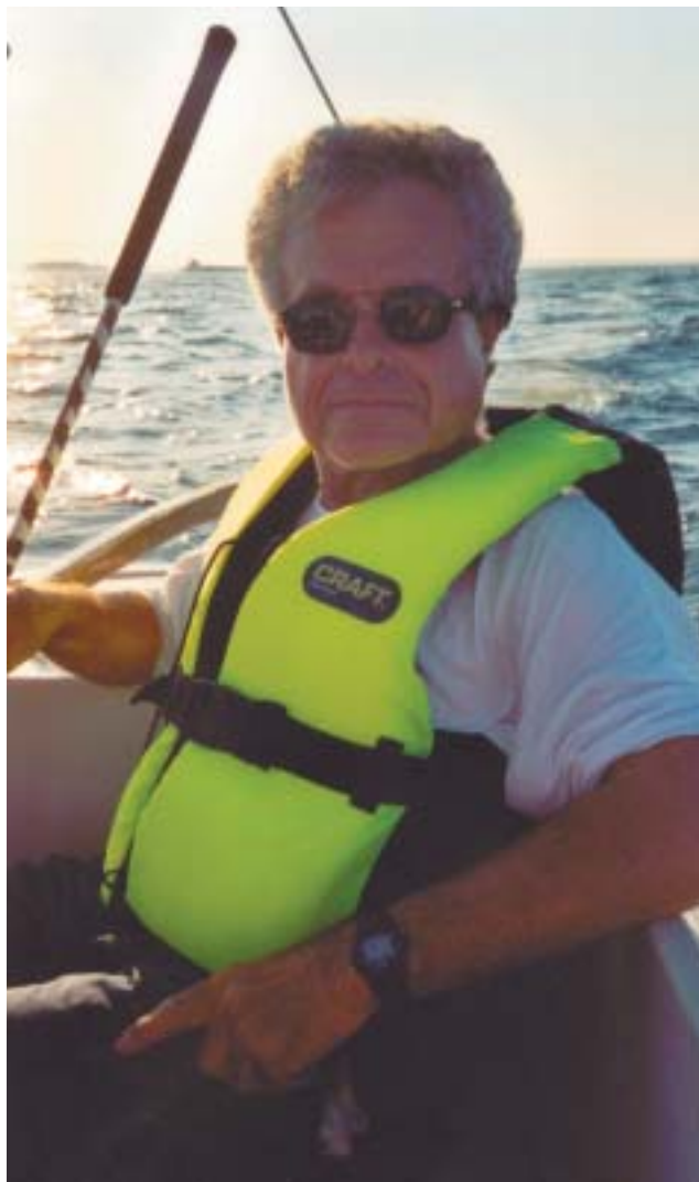
Marek vid rodet.

I år är det 30 år sedan första numret av föregångaren till Medvind, i form av ett offsettryck och med namnet "IF-båten" kom ut. Regionala avdelningar på Västkusten och Ostkusten hade bildats och tre till var på gång. Förbundet, som bildats vid början av sjuttioalet, hade då redan fått IF-båten klassregler godkända hos Seglarförbundet och bjudit in till tre internationella SM. Och sedan den tiden har man utan avbrott seglat SM varje år på olika platser i vårt avlång land. I medeltal har vi varit fler än 40 stycken på startlinjen. I år är det 34:e SM-gången gillt, utan något avbrott, och det är Upsala Segelsällskap som står i tur att anordna seglarfesten,